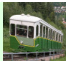
Sommerbergbahn Bad Wildbad

Mit der Sommerbergbahn in Bad Wildbad geht es zunächst hoch auf den Sommerberg. Von dort gelangen wir über die Grünhütte nach Kaltenbronn. Weiter auf der Landstraße L 76b geht es in Serpentinaen hinauf zur Hauptstrecke am Kaiser-Wilhelm-Turm.