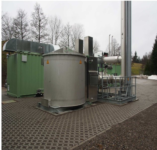
Schwachgasbehandlung mit der VocsiBox der Fa. BMF Haase Energietechnik GmbH

Die Schwachgas behandlung erfolgt mittels eines autothermen Reaktors, der sogenannten VocsiBox. Das Gas wird dabei über ein in einem isolierten Behälter befindliches Keramikbett geleitet und dort bei etwa 1000°C flammenlos oxidiert. Die dabei entstehende Abwärme wird in den Wintermonaten für die Beheizung der Deponiegebäude genutzt.