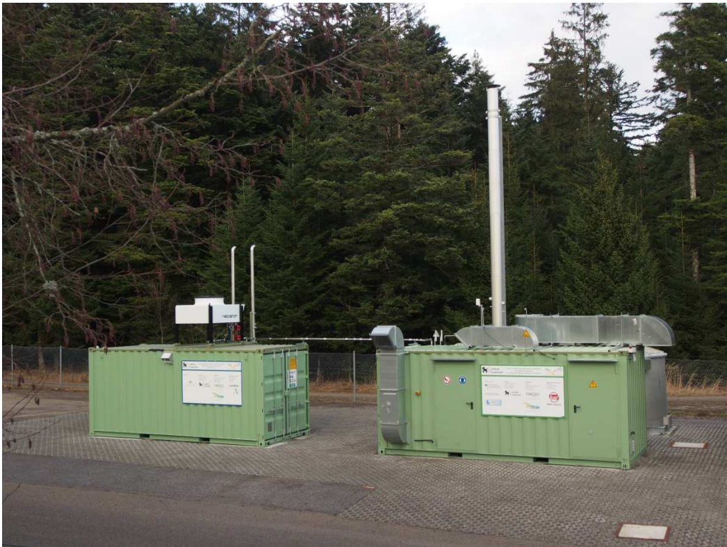
Fertiggestellte Anlagen: rechts Schwachgasbehandlung mit der VocsiBox links Gutgasverwertung mit Sterlingmotoren

Damit leistet der Landkreis Freudenstadt einen wesentlichen Beitrag zum Klimaschutz und ebenso im Rahmen der Teilnahme des Landratsamtes am European Energie Award®.